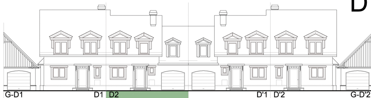
ELEWACJA FRONTOWA / WSCHODNIA